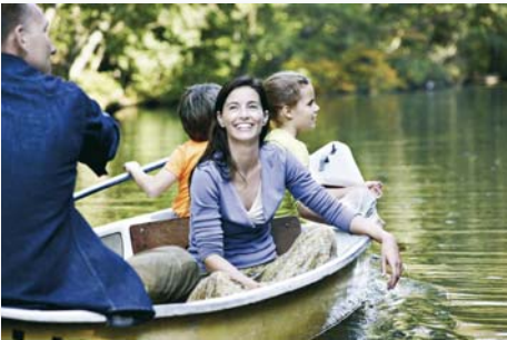
Den Frühling hören mit dem neuen Widex clear440.

Sie kennen das vielleicht noch aus dem Physikunterricht zum Thema Akustik: Für das räumliche Hören brauchen wir beide Ohren, denn ein Schallsignal kommt auf dem einen Ohr immer um Bruchteile von Sekunden später oder früher an, als auf dem anderen Ohr. Diese Informationen wiederum werden von unseren Ohren blitzschnell ausgetauscht und an das Gehirn weitergeleitet. Ist das Gehör auf einem oder beiden Ohren geschädigt, wird es deshalb schwieriger, Sprache klar zu verstehen oder Schallsignale im Raum richtig zu orten. Bei dem neuen Hörsystem clear440 von Widex haben sich die Entwickler deshalb